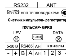
Рис. 7.1 Схема клеммников счетчика

Подключение внешнего батарейного питания и внешнего постоянного питания осуществляется через клеммники плюс и минус питания 5-20В